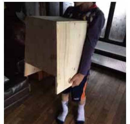
軽いので持ち運びも簡単です。

ともにつくる ともにとだてる ともにあそぶ ともにとる ともにとる ともにとる ともにとる ともにとる ともにとる ともにとる