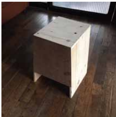
スツールとして使うこともできます。

ともにつくる ともにとだてる ともにあそぶ ともにとる ともにとる ともにとる ともにとる ともにとる ともにとる ともにとる